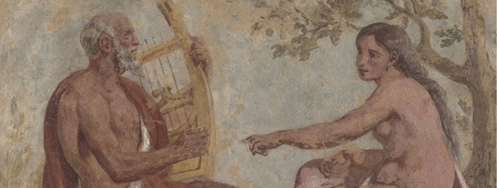
Eugène Delacroix, Anacréon et une jeune fille (détail)