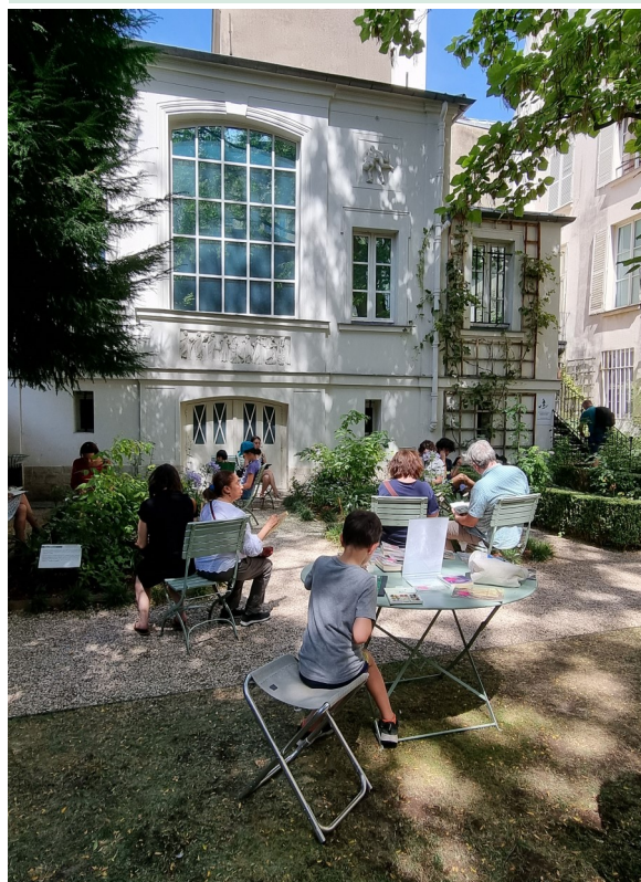
Vue extérieure de l'atelier Delacroix

Un aquarelliste vous suit dans le jardin pour vous accompagner dans la réalisation d'une aquarelle de votre invention. Le matériel est fourni par le musée mais vous pouvez également venir avec votre propre matériel.