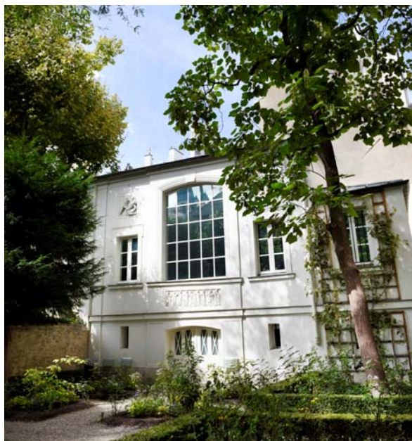
Vue extérieure de l'atelier Delacroix

Une soirée lecture sur le thème des objets