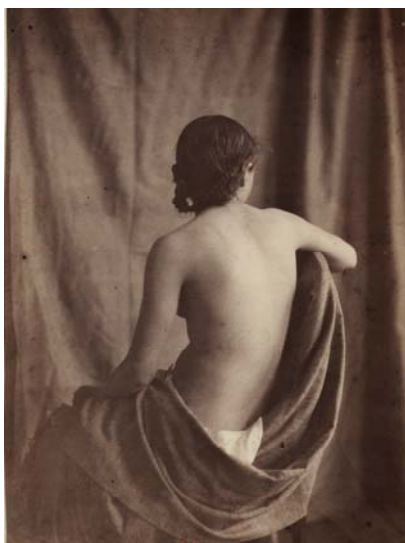
Eugène Durieu, Étude de modèle , BnF, Département des Estampes et de la photographie, Paris © BnF

Programmation : Monica Preti-Hamard assistée de Charlotte Chastel-Rousseau