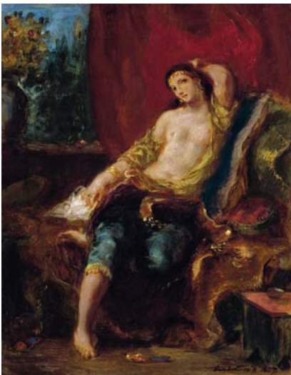
Eugène Delacroix, Odalisque , 1857. Huile sur bois. 35,5 x 30,5 cm. Collection particulière

« Je regarde avec passion et sans fatigue ces photographies d'après des hommes nus, ce poème admirable, ce corps humain sur lequel j'apprends à lire. »