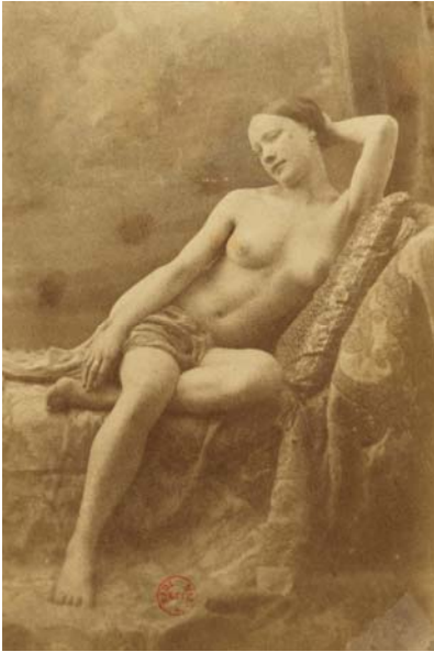
Eugène Durieu, Nu féminin assis sur un divan, la tête soutenue par un bras (planche XXIX de l' Album Durieu ). Papier salé verni d'après négatif papier. 14 x 9,5 cm. BnF, Département des Estampes et de la Photographie