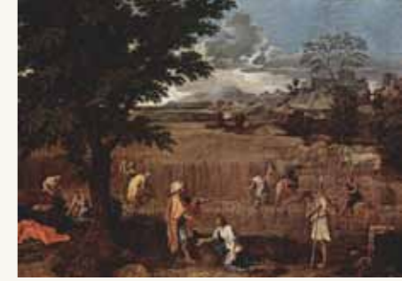
Nicolas Poussin L'Été ou Ruth et Booz