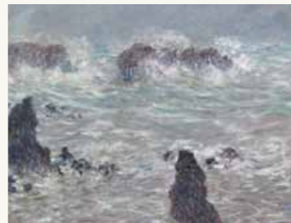
Claude Monet Tempête, côtes de Belle-Île

La vague sublime provoque une « terreur délicate » disait Diderot : le spectateur est protégé par la vitre sur le cadre mais veut y croire ! L'affrontement de l'eau et de la roche évoque un paysage marin, mais aussi les tumultes de l'esprit. « En se promenant sur une falaise, on sent qu'il y a des océans sous le crâne comme sous le ciel » écrit Victor Hugo. La vague qui se brise est un paysage mental. Plus tard Monet, le grand maître de l'impressionnisme, peindra une série de toiles intitulée Tempête sur la côte de Belle-Île : des vagues se heurtant aux rochers. Comme cette aquarelle, elles saisiront sur le vif une force authentique, toute la violence du choc de la mer déchaînée contre la roche abrupte.