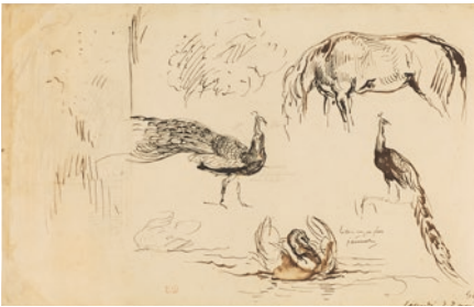
Eugène Delacroix (1798-1863), Étude de deux paons, d'un cygne et d'un cheval 1854 Crayon et encre brune sur papier ; 24,3 x 28 cm Paris, musée national Eugène-Delacroix – Inv. MD 2022-3