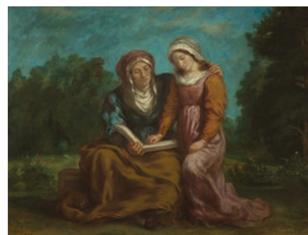
Eugène Delacroix (1798-1863), L'Éducation de la Vierge 1842 Huile sur toile ; 95 x 125 cm Paris, musée national Eugène-Delacroix – Inv. MD 2003-8