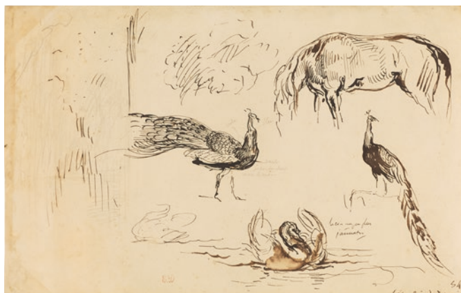
Eugène Delacroix (1798-1863), Étude de deux paons, d'un cygne et d'un cheval 1854 – Crayon et encre brune sur papier ; 24,3 x 28 cm Paris, musée national Eugène Delacroix – Inv. MD 2022-3

Cette sélection de dessins des collections du musée national Eugène-Delacroix et du musée départemental Gustave Courbet met particulièrement en valeur le thème du rapport des artistes à la nature, dont la représentation a été profondément renouvelée au XIX e siècle.