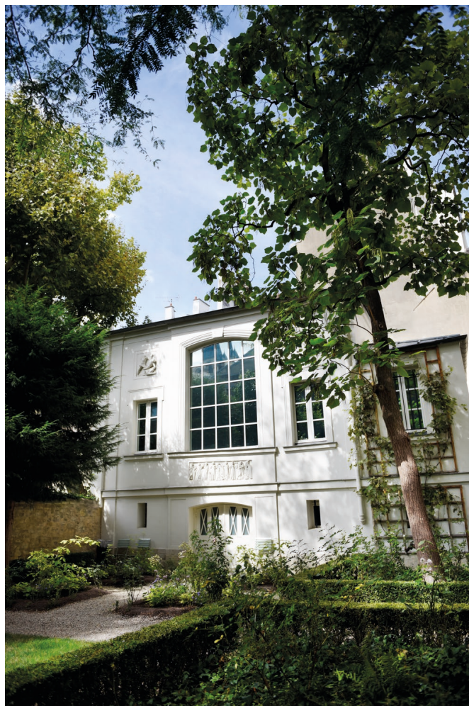
Vue de l'atelier d'Eugène Delacroix