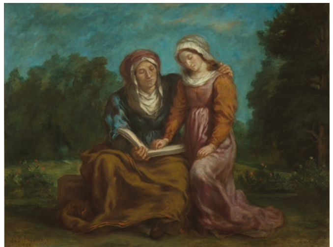
Eugène Delacroix (1798-1863), L'Éducation de la Vierge 1842 – Huile sur toile ; 95 x 125 cm Paris, musée national Eugène-Delacroix – Inv. MD 2003-8

C'est le cas de tableaux comme Étude d'homme nu dit Le Polonais et Étude d'après un des Caprices de Goya, deux plats de reliures médiévales et une veste orientale que Delacroix a conservés avec lui toute sa vie et qui se trouvaient dans la vente posthume de son atelier. En effet, les peintures qu'il considérait comme des études n'avaient pas vocation à être exposées ou vendues mais à lui servir de référence, de source d'inspiration ou de souvenir. Elles pouvaient ainsi nourrir sa mémoire et ses créations.