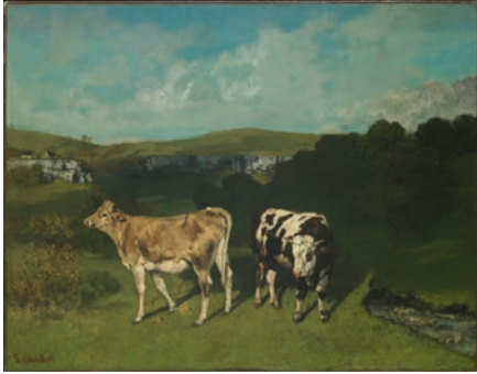
Gustave Courbet (1819-1877), Taureau blanc et génisse blonde Vers 1850 Huile sur toile ; 91,5 x 116,5 cm Ornans, musée départemental Gustave Courbet – Inv. 2002.3.1