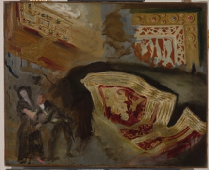
Eugène Delacroix (1798-1863), Étude d'après un des Caprices de Goya, deux plats de reliures médiévales et une veste orientale Vers 1825 Huile sur toile ; 50 x 61 cm Paris, musée national Eugène-Delacroix – Inv. MD 2011-1