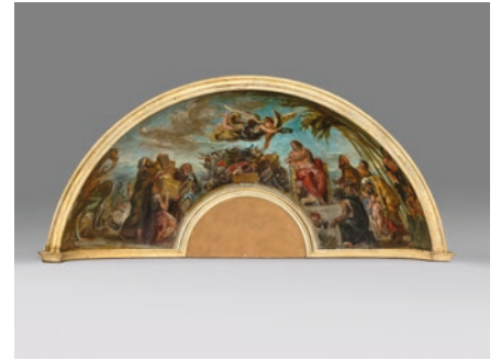
Eugène Delacroix (1798-1863), Esquisse pour Alexandre faisant enfermer les poèmes d'Homère dans un coffret d'or Vers 1840-1846 Huile sur toile marouflée sur carton ; 48 x 127 cm Paris, Musée national Eugène-Delacroix – Inv. MD 2017-7