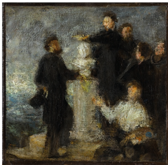
Henri Fantin-Latour (1836-1904), Esquisse pour l'Hommage à Delacroix Vers 1863 – Huile sur toile ; 25,5 x 26 cm Paris, musée national Eugène-Delacroix – Inv. MD 2008-21

De son vivant, Eugène Delacroix occupe une place importante dans le panthéon des jeunes générations d'artistes. Coloriste audacieux, fervent défenseur de l'imagination, et créateur d'images emblématiques, il devient l'objet d'admiration plurielles, évoquées ici par des copies de ses œuvres réalisées par des peintres aussi divers que l'orientaliste Théodore Chassériau (1819-1856), le classique William Bouguereau (1825-1905) ou encore le réaliste Henri Fantin-Latour (1836-1904).