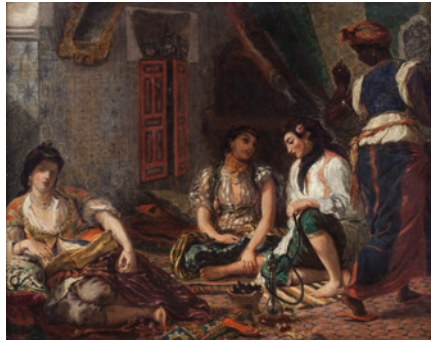
Henri Fantin-Latour (1836-1904), Copie d'après Les Femmes d'Alger dans leur appartement d'Eugène Delacroix 1876 Huile sur toile ; 73,9 x 93,8 cm Paris, musée national Eugène-Delacroix – Inv. MD 2015-9