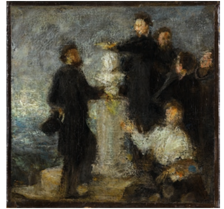
Henri Fantin-Latour (1836-1904), Esquisse pour l'Hommage à Delacroix Vers 1863 Huile sur toile ; 25,5 x 26 cm Paris, musée national Eugène-Delacroix – Inv. MD 2008-21