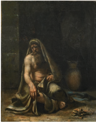
Gustave Courbet (1819-1877), Pirate prisonnier du dey d'Alger 1844 Huile sur toile ; 81,3 x 65,4 cm Ornans, musée départemental Gustave Courbet – Inv. 1992.1.1