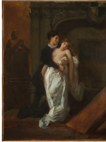
Eugène Delacroix (1798-1863), Roméo et Juliette (scène des tombeaux des Capulets) 1851 Huile sur papier marouflée sur toile ; 35,2 x 26,5 cm Paris, musée national Eugène-Delacroix – Inv. MD 2008-3