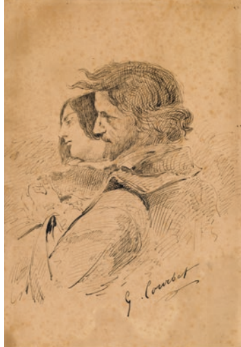
Gustave Courbet (1819-1877), Les Amants dans la campagne Vers 1867 Encre sur papier vélin ; 28,7 x 20 cm Ornans, musée départemental Gustave Courbet – Inv. 1976.1.12