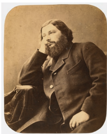
Nadar (1820-1910), Portrait de Gustave Courbet Vers 1861 Épreuve sur papier albuminé ; 23,6 x 19 cm Ornans, musée départemental Gustave Courbet – Inv. 1976.1.62