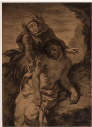
Eugène Delacroix (1798-1863), Étude pour une Pietà 1840-1860 Fusain sur papier ; 20,5 x 28,5 cm Paris, musée national Eugène-Delacroix – Inv. MD 2021-8