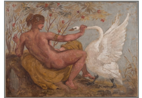
Eugène Delacroix (1798-1863), Léda et le cygne 1834 Fresque ; 88 x 67 cm Paris, musée national Eugène-Delacroix – Inv. MD 1992-2