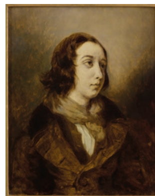
Eugène Delacroix (1798-1863), Portrait de George Sand 1834 Huile sur bois ; 27,2 x 21,5 cm Paris, musée national Eugène-Delacroix, acquis avec la participation de la Société des Amis du musée national Eugène-Delacroix – Inv. MD 2016-1