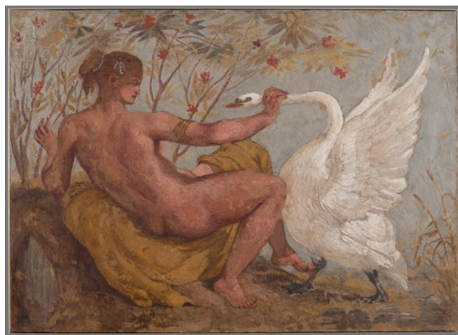
Eugène Delacroix (1798-1863), Léda et le cygne 1834 – Fresque ; 88 x 67 cm Paris, musée national Eugène-Delacroix – Inv. MD 1992-2

De ses premiers essais de fresques à l'abbaye de Valmont en 1833 à la chapelle des Saint-Anges à Saint-Sulpice qu'il achève en 1861, dont l'artiste s'est rapproché en s'installant rue de Furstemberg, en passant par les bibliothèques de l'Assemblée nationale au Palais Bourbon (1838-1847) et du Sénat au palais du Luxembourg (1841-1846), les décors des édifices civils et religieux ont beaucoup compté dans les trente dernières années de la carrière d'Eugène Delacroix. Pour le peintre, ils constituent à la fois un défi et un moyen de se mesurer avec les grands artistes du passé.