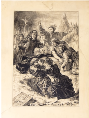
Eugène Delacroix (1798-1863), Hamlet et Laërte dans la fosse d'Ophélie 1843 Pierre lithographique ; 38,2 x 27,4 cm Paris, musée national Eugène-Delacroix – Inv. MD 2002-108