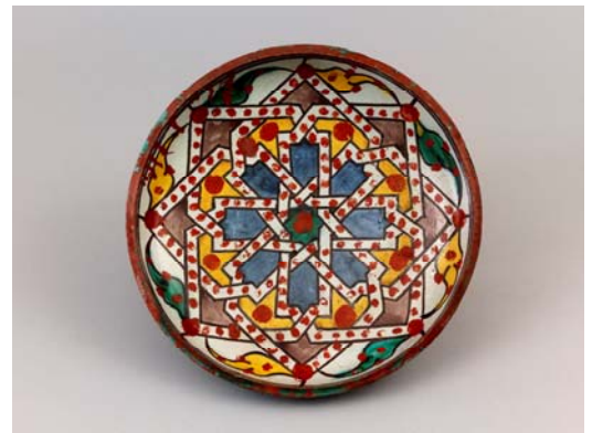
Plat rond (tobsil)