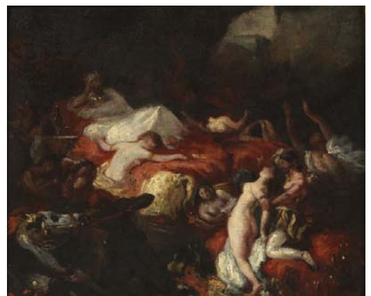
La mort de Sardanapale , d'après Eugène Delacroix, Hippolyte Poterlet