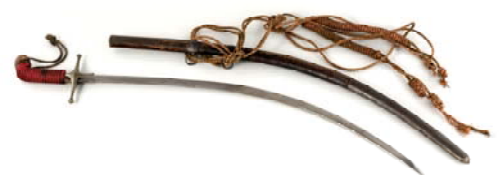
Sabre marocain (kildj) et son fourreau