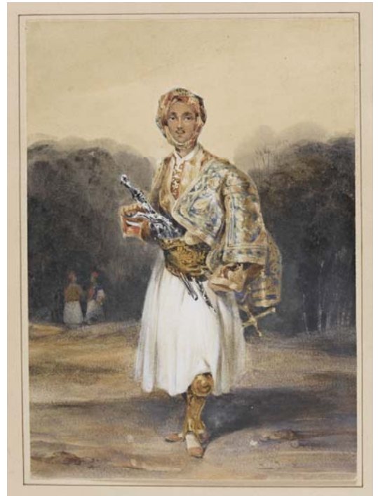
Personnage en costume souliote , Eugène Delacroix