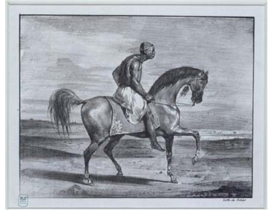
Le nègre à cheval, Eugène Delacroix

Au 19 ème siècle, le voyage en Orient, d'abord imaginaire, devient réalité. Il attire peintres, écrivains – comme Théophile Gautier ou Gustave Flaubert –, marchands et soldats. L'Orient lointain devient ainsi plus proche, tout en étant toujours regardé à travers le prisme des représentations anciennes. L'Orient se conçoit du point de vue de l'Occident, comme l'a montré Edward Saïd dans son ouvrage fondateur Orientalisme , paru en 1975. Il paraît, aux yeux des occidentaux, comme un double séduisant et dangereux, mais auquel une identité propre et singulière est refusée.