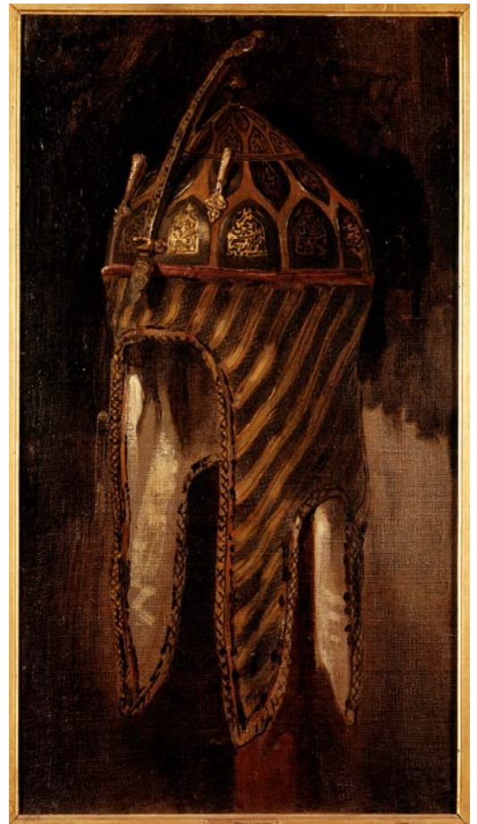
Etude de casque circassien , Eugène Delacroix

La Mort de Sardanapale qu'il peint en 1827 lui est inspirée par une pièce de théâtre de Lord Byron, un écrivain anglais qu'il admirait beaucoup. Le musée Delacroix conserve plusieurs interprétations de cette peinture magistrale, chef-d'œuvre du peintre, dont une conçue par un de ses amis proches, Hippolyte Poterlet, au moment où Delacroix la réalisait. La Mort de Sardanapale puise à un orient historique et imaginaire, à la fois séduisant et cruel, sombre et flamboyant. La présence de l'éléphant souligne cet exotisme délibéré, recherche d'un ailleurs fantasmé qui libère le cadre de la représentation.