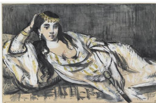
Odalisque , Edouard Manet