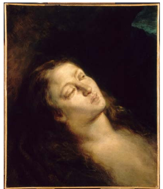
La Madeleine au désert , Eugène Delacroix