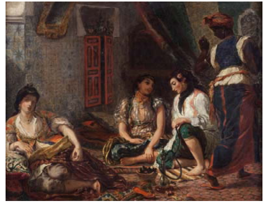
Les femmes d'Alger, Fantin-Latour Ignace Henri Jean Théodore, d'après Eugène Delacroix

Pour leur part, les militaires développent une théorie qui oppose la guerre civilisée à la guerre barbare. Il y aurait une « guerre civilisée » en Europe qui s'opposerait à la « guerre sauvage » pratiquée en dehors de l'Europe. Pour venir à bout des sauvages, il convient, expliquent les théoriciens européens de la guerre, de prendre des mesures hardies et résolues car « des fanatiques et des sauvages doivent être rigoureusement soumis et effrayés, sans quoi ils se soulèveront à nouveau ». Cette vision ignore l'extrême diversité des manières occidentales de faire la guerre et essentialise l'ennemi.