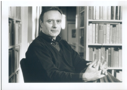
Jean-Louis Schefer © John Foley – P.O.L