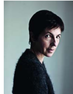
Christine Angot