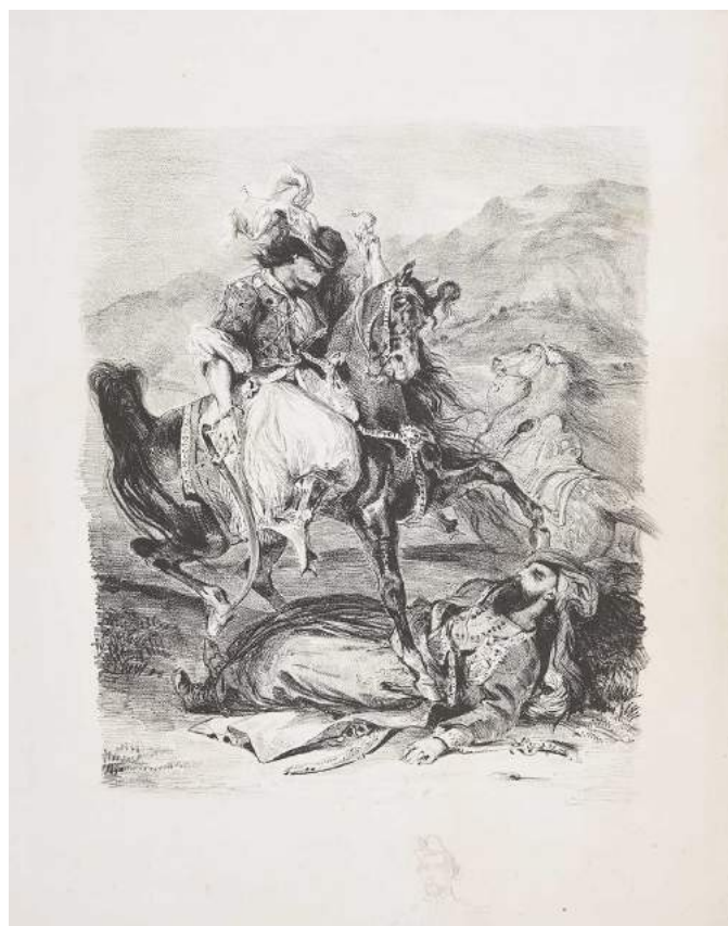
Eugène Delacroix, Le combat du Giaour et du Pacha