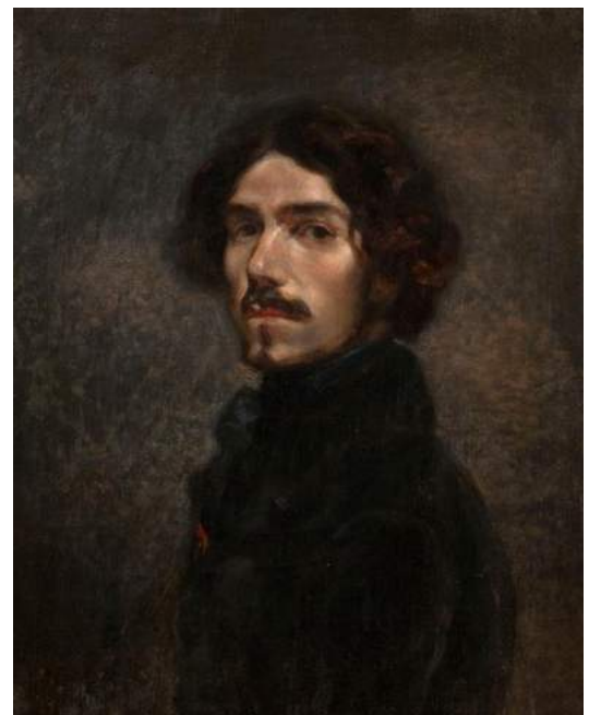
Hippolyte-Charles Gaultron, Portrait de Delacroix d'après l'Autoportrait des Offices , © RMN-Grand Palais (musée du Louvre) / Mathieu Rabeau