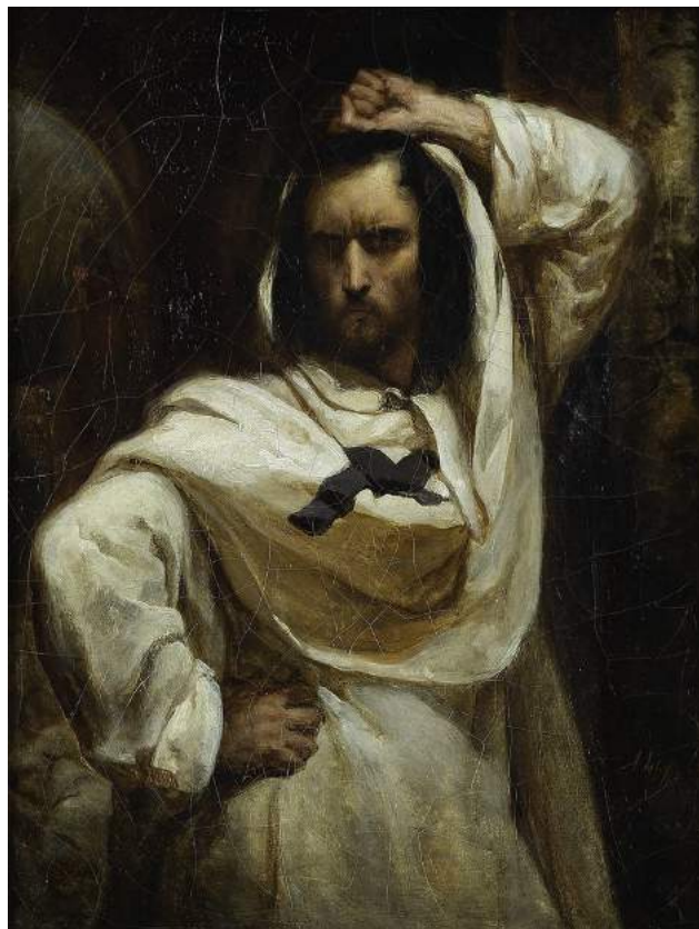
Ary Scheffer, Etude pour le Giaour

Gustave Flaubert, Dictionnaire des idées reçues