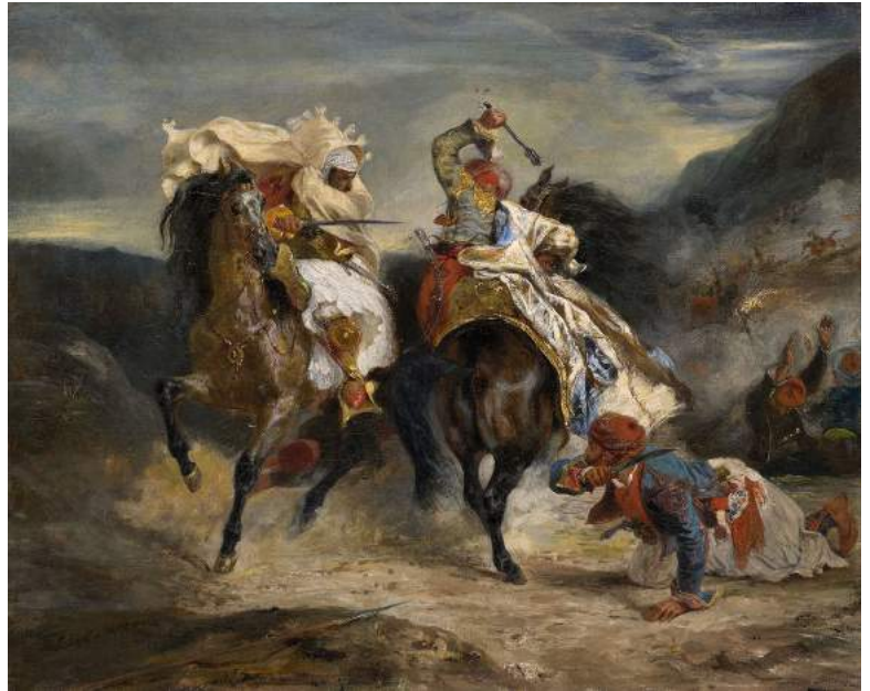
4. Eugène Delacroix, Le combat du Giaour et du Pacha , 1826 Chicago, Art Institute Huile sur toile. H. 59,6 ; L. 73,4 cm