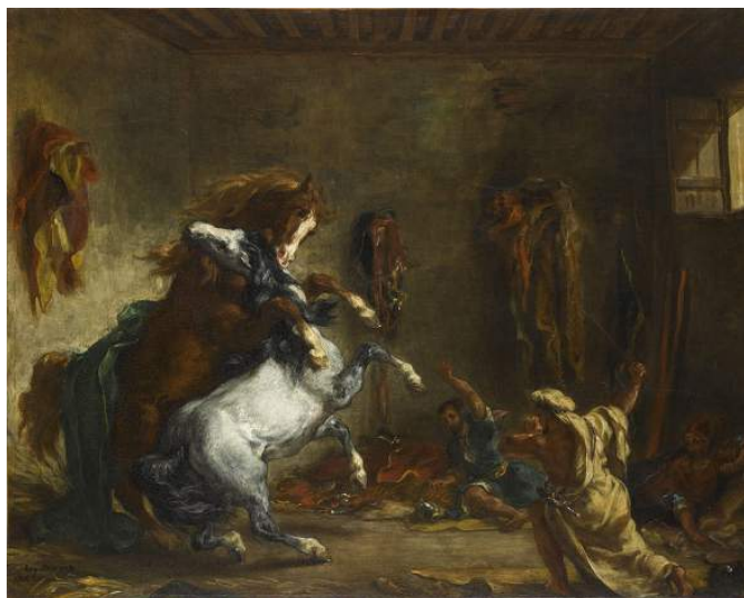
Eugène Delacroix, Chevalier se battant dans une écurie . Paris, Musée du Louvre

“ Les auteurs modernes n'ont jamais tant parlé du duel que depuis qu'on ne se bat plus. C'est le ressort principal de leurs narrations ; ils donnent à leurs héros une bravoure indomptable ; il semble que s'ils peignaient des poltrons, le lecteur aurait mauvaise idée de la vaillance de l'auteur. Les héros de lord Byron sont tous des matamores, des espèces de mannequins, dont on chercherait en vain les types dans la nature. ”