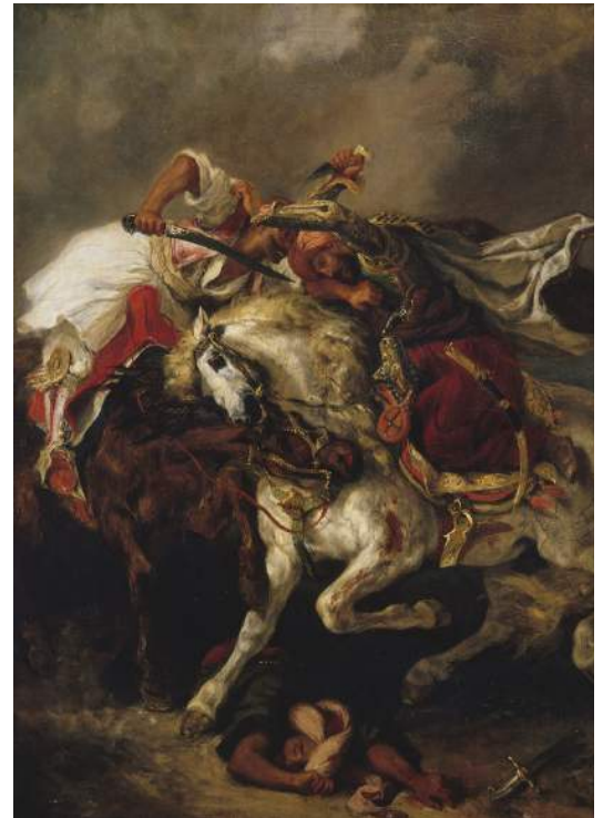
Eugène Delacroix, Le combat du Giaour et du Pacha , 1835

L'exposition "Un duel romantique, Le Giaour de Lord Byron par Delacroix" est accompagnée d'un ensemble de contenus en ligne ainsi que de conférences, de concerts, de visites dans un cadre unique, au cœur du dernier lieu de vie et de création du peintre Eugène Delacroix.