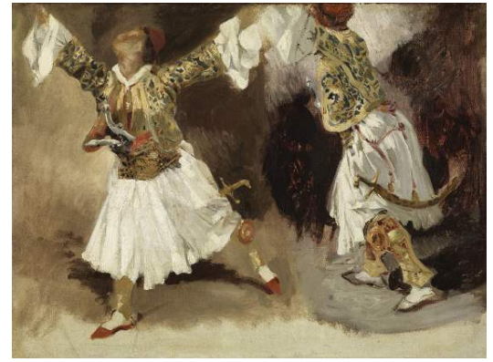
Eugène Delacroix, Deux études de costumes souliotes

Une déambulation insolite, au rythme de lectures, de poèmes, entre chef-d'œuvre plastique et littérature épique.