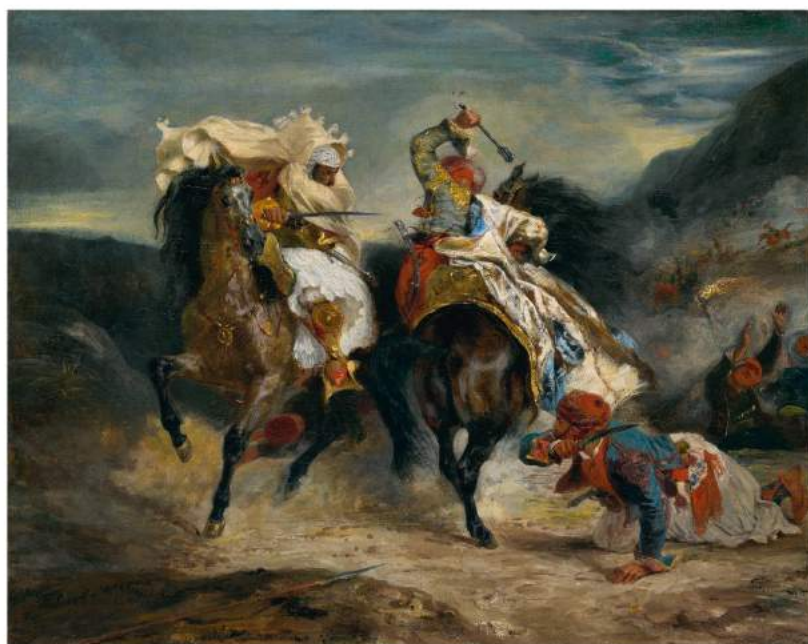
Eugène Delacroix, Le Combat du Giaour et du Pacha , version de 1826, conservée à l'Art Institute de Chicago

L'ouvrage montre également comment des artistes, comme Hector Berlioz, Ary Scheffer ou Alexandre Dumas, ont pu illustrer Le Giaour dans tous les domaines : peinture, théâtre, musique... jusqu'au xx e siècle.