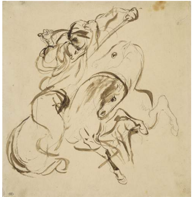
8. Eugène Delacroix, Deux cavaliers combattants , vers 1826 Paris, Musée du Louvre, Département des Arts Graphiques Graphite sur papier. H. 25,1 ; L. 15,9 cm