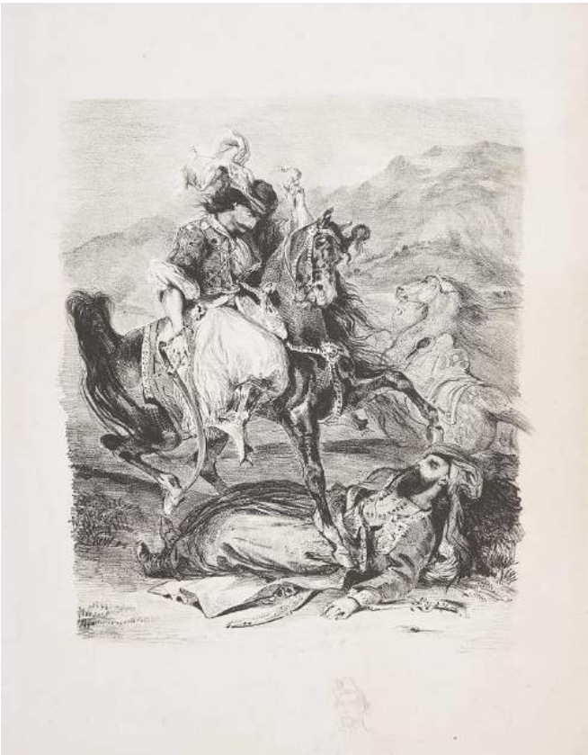
7. Eugène Delacroix, Le combat du Giaour et du Pacha , 1827 Paris, Musée national Eugène-Delacroix Lithographie sur papier, 2e état. H. 40,5 ; L. 32,5 cm