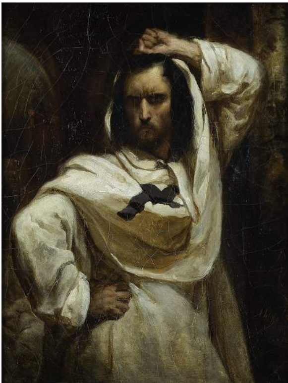
9. Ary Scheffer, Etude pour le Giaour , 1832 Paris, musée de la Vie Romantique, Paris Musée Huile sur toile. H. 33 ; L. 25 cm