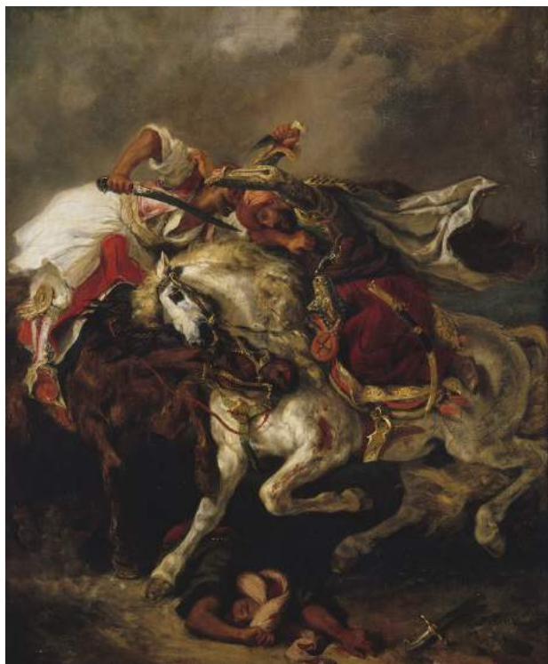
Eugène Delacroix, Le combat du Giaour et du Pacha , 1835 © Paris Musées / Musée des Beaux-Arts de la Ville de Paris, Petit Palais