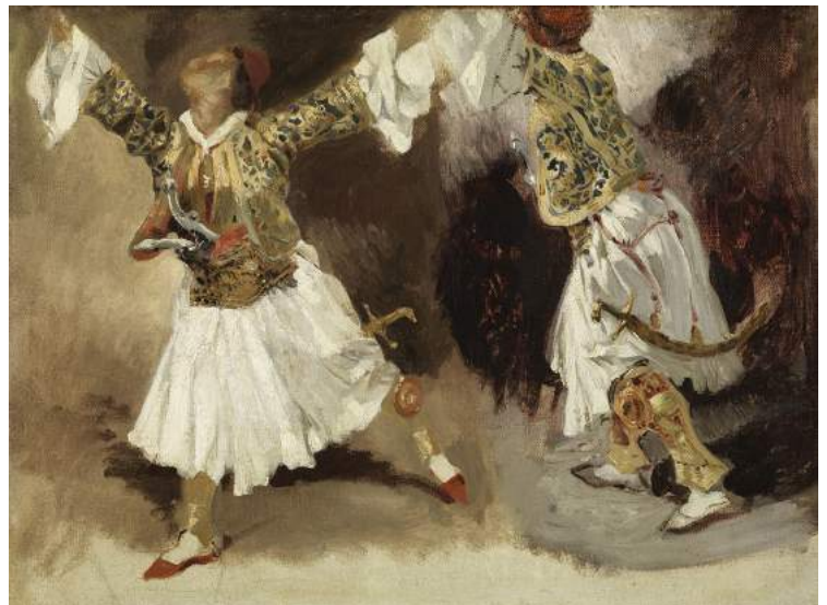
6. Eugène Delacroix, Deux études de costumes souliotes, 1823-1826 Paris, musée du Louvre, Département des peintures Huile sur toile. H. 35 ; L. 46 cm