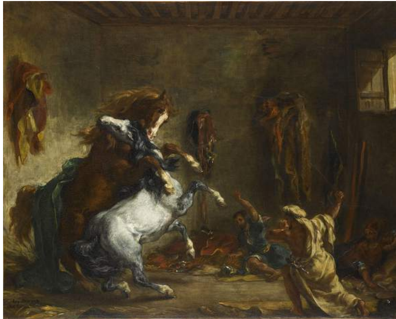
5. Eugène Delacroix, Chevaux arabes se battant dans une écurie , 1860 Paris, musée d'Orsay, Dépôt du musée du Louvre, Département des Peintures Huile sur toile. H. 65,5 ; L. 81 cm